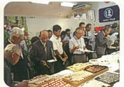
平成 26 年度 試食会風景