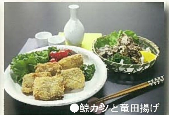
●鯨カニと竜田揚げ